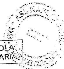
TABELLE DIETETICHE Terza settimana