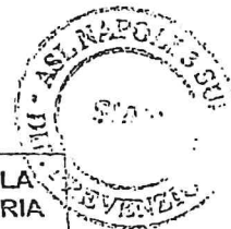
TABELLE DIETETICHE Prima settimana