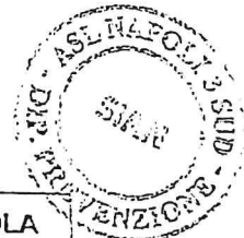
TABELLE DIETETICHE Seconda settimana

Direttore: Dott. Pierluigi... Via Montedoro 47 - Torre del Greco (CA) Tel. 081/8490160 - 0159 E-mail siaen@pec.aslnapoli3sud.it Sito: www.aslnapoli3sud.it