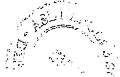
TABELLE DIETETICHE Quarta settimana