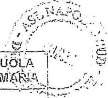
TABELLE DIETETICHE Prima settimana

Via Montedoro 47 - Tel. 081/8490100 Tel. 081/8490100 E-mail siaen@pec.asinapoli.it Sito: www.asinapoli.it